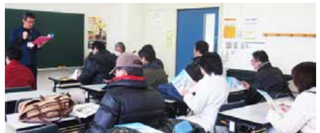
館内説明を聞いています

係の方に館内施設を案内していただいた後、特別にお昼休みの体育館を使って『ボッチャ』というスポーツを体験させていただきました。さっそく当日、会員登録をした方もいて有意義な一日でした。