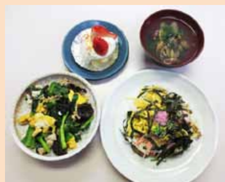
【献立】ちらし寿司／豚とキクラゲの玉子炒め／アサリのすまし汁／いちごのロールケーキ

料理教室にはコーチはいませんが、事前にトレイニーのミーティングを重ね、献立決めから始めます。今年度は季節感を意識して献立を考えていくことになり、アンケートもとってみました。グループ分けをして段取りや担当を決め、毎回レシピ集も作ります。材料は前日に自分達で近くのスーパーまで買い物に行きます。遂行機能とコミュニケーションに最適なトレーニングです。