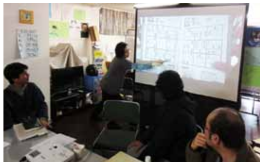
当事者会にてナンプレの紹介

当日は、自分が“輝いていたころの写真”を持ってきて皆に見てもらったり、今ハマっていることとしてナンプレ(数独)を紹介する人がいたり、海外旅行の体験が話題に出たりしました。それらに対するやり取りを通じて、ドリームの中だけでは知りえないそれぞれの側面が垣間見られて、楽しい時間でした。