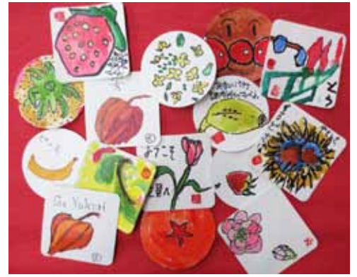
今月の絵手紙「コースター」