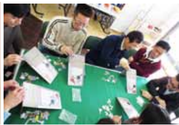
じゅんさんのゲームの時間。毎回新しいゲームに、みんな夢中です