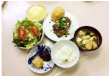
ハンバーグランチ☆美味しかった！