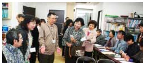
↑お席にご案内します

《参加者:トレイニー 22名、家族・ボランティア 18名、お客様 15名、職員 7名 計 62名》