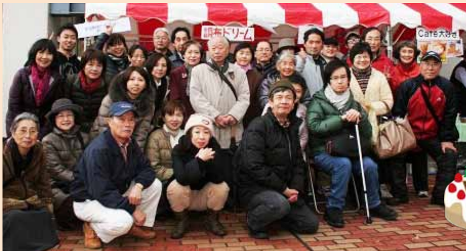
寒かったけど頑張りました