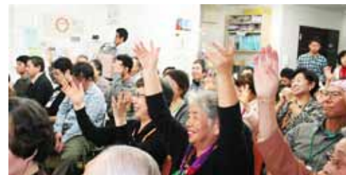
↑覚えてたての手話拍手