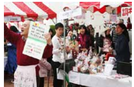
↑高次脳にご理解を

両手からあふれるほど多くのトレイニー・ご家族のかたとお会いし、充実した時間と空間を共有でき、ありがたい・嬉しい一日でした。お疲れ様。準備を下さった「縁の下の力持ち」スタッフをはじめとする皆さんありがとう。