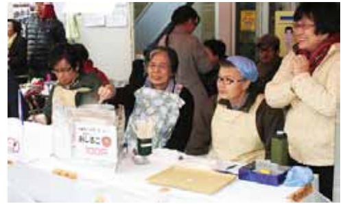
↑温かいおしるこはいかが?

調布の福祉まつりに総勢45名で参加しました。当日は大変寒い日でした。おしるこ210食を完売、グッズメイクのリハビリで作成したクリスマスリースなども大きな声で呼び込みをして皆で頑張っておしるこを売りました。この日のために何ヶ月も前から音楽の時間に練習したトーンチャイム演奏や歌の発表が、午後から降り出した冷たい雨のため中止になってしまいました。ステージではトレイニー5人による自己紹介もする予定でしたが、出来ませんでした。心を打つすばらしい発表だっただけに、とてもとても残念でした。