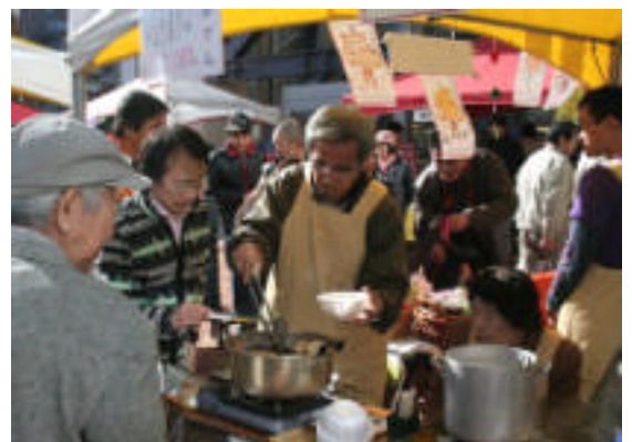
< 福祉まつりでおでん売りはだれ? >